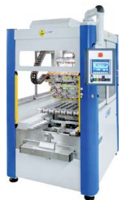
RobiFlex 2x1 RobiFlex 2x1