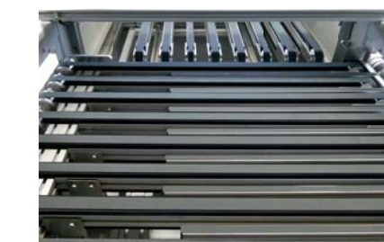
Riemenbahn Belt conveyor