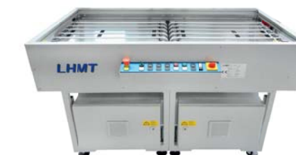
Riemenbahn 2-fach Double belt conveyor