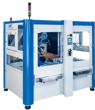
RobiFlex 6x2 RobiFlex 6x2