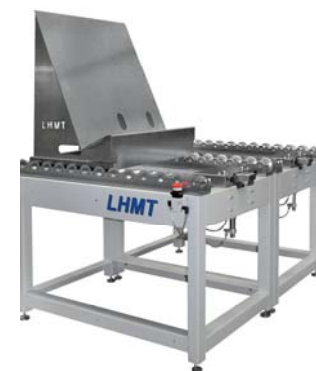
PFS2 Pufferspeicherplatz PFS2 magazine buffer