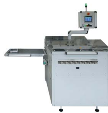
EUS Eckumsetzer mit Riementransport EUS corner transfer module with belt transport