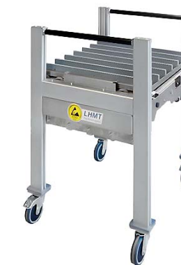
Transportwagen Transport cart