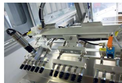
Elektrisch angetriebener Vereinzler Electrically driven separator