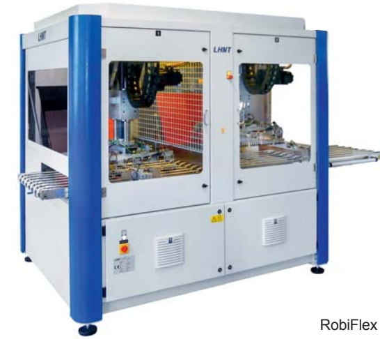
RobiFlex 2x2 RobiFlex 2x2

The LHMT RobiFlex series offers customer-focused solutions for PCB handling. Our transport systems can be integrated or adapted.