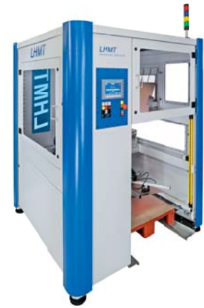
RobiFlex 6x1 RobiFlex 6x1