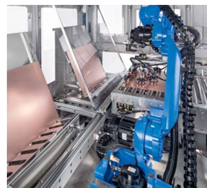
Be- und Entladen mit Roboter Loading and unloading with robot