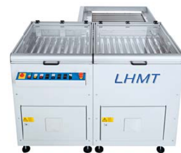
EUS Eckumsetzer mit Rollentransport EUS corner transfer module with roller transport